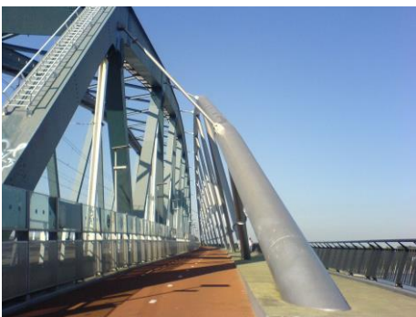
Snelbinder Waalspoorbrug

De afdelingen constateren dat los van het fietspad langs de spoorbrug er nu al aanzienlijke infrastructurele verbeteringen in de verbinding mogelijk en nodig zijn. In Schalkwijk kan de bestaande route worden verkort met ca. 1 km fietspad langs het spoor via Tetwijkseweg en Pothuizerweg met een verbinding naar de Lekdijk ter hoogte van de spoorbrug. In Culemborg is dringend behoefte aan goede doorgaande fietsroutes. Met het realiseren van deze verbeteringen zouden de gemeentebesturen zelf al de daad bij de woorden van de motie kunnen voegen.