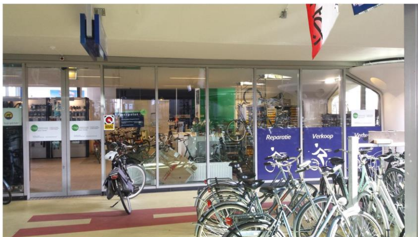
KRAAN TWEEWIELERS in Transferium Houten