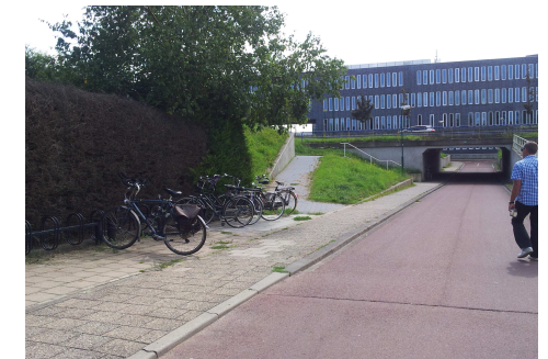
In vakantietijd is er ruimte genoeg.

Tot nu toe is dus van de adviezen alleen een kleine uitbreiding aan de zuidzijde gerealiseerd. We zullen een en ander echter in het Verkeersberaad wederom aankaarten.