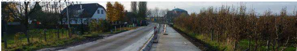
Foto 1 Oostrumdijkje

Voor meer informatie over het vrijliggende fietspad langs de Beusichemseweg van de rondweg tot aan 't Goy, kijk op www.houten.nl/werkaandeweg