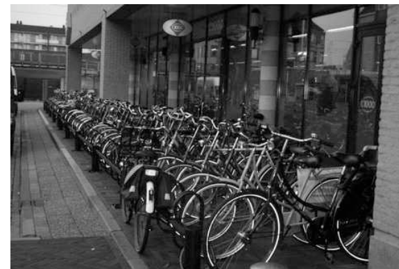
Foto's vorige twee en deze pagina: fietsen, fietsen en nog eens fietsen.

Ook blijkt uit het tellen dat niet overal klemmen geplaatst hoeven te worden, maar wel een plek aan te wijzen waar men een fiets veilig op de standaard neer kan zetten met een aanbindmogelijkheid. ◀