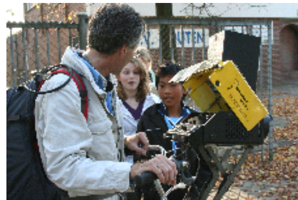
Foto Het voorgedeelte van de techfiets met apparatuur voor de registratie van het wegbeeld, de trilling, verkeerslawaaai, oponthoudt en de luchtkwaliteit. (C. van Angelen)

Tijdens het meten door onze vrijwilligers van de fietsersbond Houten is