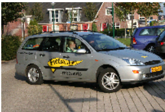
Foto: De meetfiets was eerder op de plek van aankomst, hier Zandsteen 7, dan de meetauto, hetgeen vaak het geval was.