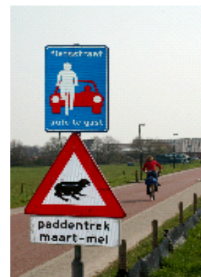
Foto: Wat is het duidelijkste bord, dat van de fietsstraat of van de paddentrek? (R. Wiercx)

directeur van de Fietsersbond). Hij had in het midden van de weg een markering laten