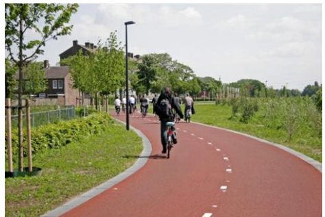
Voorbeeld van 'vergevingsgezind' fietspad

van de 'vergevingsgezindheid' van de fietsweg en functioneert als een goede vorm van doorgaande 'kantbelijning'. De weg wordt optisch breder, maar de snelheid van het gemotoriseerde verkeer wordt gematigd, door toepassing van de 'schrikstrook'.