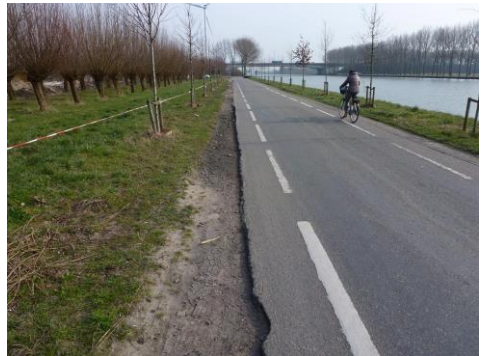
De Heemsteedseweg nu.

Op een vergevingsgezind uitgevoerde fietsweg hebben fietsers, vooral ouderen, minder risico op een éézijdig ongeval onder andere doordat fietsonvriendelijke obstakels en hindernissen op/of langs het fietspad ontbreken. De Fietsersbond Houten (FBH) heeft de gemeente voorgesteld, omwille van de veiligheid, over de totale lengte van de weg aan weerszijden fietsvriendelijke, waterdoorlatende bermverhardingsstroken aan te brengen. Vooregesteld is ook daarin een strook ribbelbetonklinkers, in accentkleur, op te nemen als 'schrikstrook'.