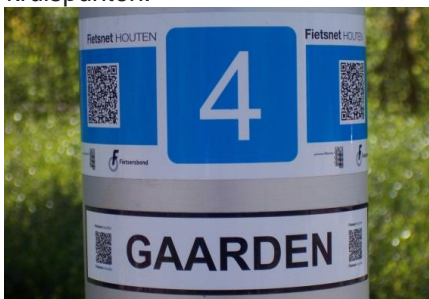
Sigarenbandjes op lantaarnpaal met QR