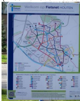
Kaart van Fietsnet Houten