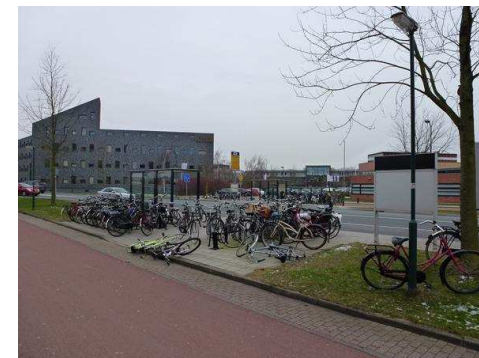
Overvolle fietsparkeerlocatie bij bushalte Molenzoom Oost / West

De Fietsersbond Houten blijft de ontwikkelingen nauwlettend volgen.