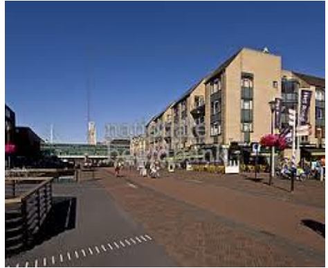
Onderdoor, mengen fietsverkeer en voetgangers

Tenslotte gaf Cor van Angelen een presentatie (“Scheiden en mengen”) over de openbare ruimte en de fietsinfrastructuur: waar kunnen verkeersdeelnemers samen optrekken, en waar is het beter om “de wegen te scheiden”? Hoe kan de schaarse ruimte veilig en effectief benut worden en hoe kunnen we als weggebruikers het best rekening met elkaar houden?