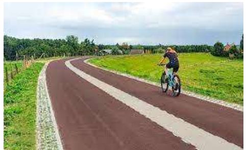
Voorbeeld van een Fietsstraat

Zoals blijkt uit punt 4 heeft de Raad ook opdracht gegeven aan het College om onderzoek te doen naar maatregelen om het doorgaande verkeer op de Lekdijk binnen het Eiland van Schalkwijk te kunnen beperken zodat de verkeersveiligheid (m.n. voor langzaam verkeer) kan worden vergroot. ■