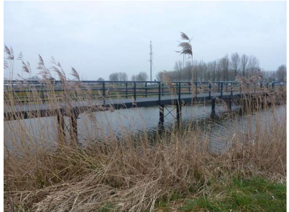
Ellispad (brug over Schalkwijkse Wetering)

Deze fietsverbinding zou een opmaat kunnen zijn voor een toekomstige fietsverbinding met Vianen. Het Utrechts FietsOverleg (UFO) heeft er begin 2015 al voor gepleit om, in samenhang met de geplande verbreding van de A27, een doorgaande fietsroute te realiseren, te weten: Utrecht-Houten-Nieuwegein-Vianen, met fietsbruggen over Amsterdam-Rijnkanaal en de Lek.