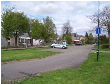
Odijkseweg bij Montessorischool