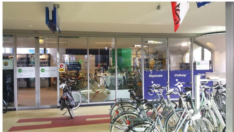
KRAAN TWEEWIELERS in Transferium Houten

Fietsreparaties Fietsverkoop, nieuw en gebruikt Fietsverhuur