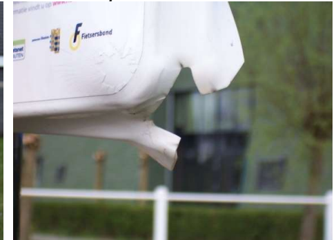
Vandalisme: bord is vernield