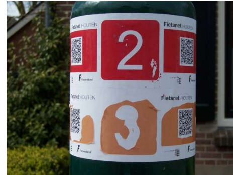
Oranje inkt bladdert af

Helaas is gebleken dat de inkt van de stickers niet weerbestendig is. Met name bij routes 2 (geel), 3 (oranje) en 8 (paars) zien we afbladderen. De fabrikant heeft inmiddels onderzoek gedaan, en nieuwe stickers geleverd, die binnenkort geplakt kunnen worden. Met vandalisme valt het wel mee. Het lijkt erop dat in een jaar enige tientallen stickers (~5 procent) beschadigd raakt.