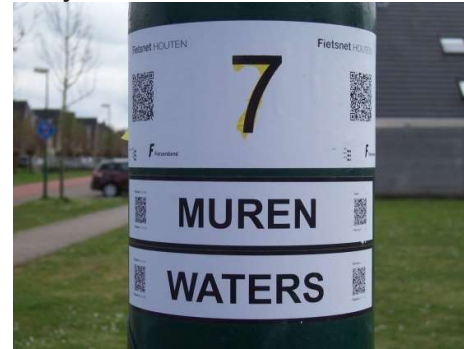
Route geel is route wit geworden!